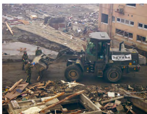
▲志津川地区での道路復旧（2011（平成23）年5月1日）