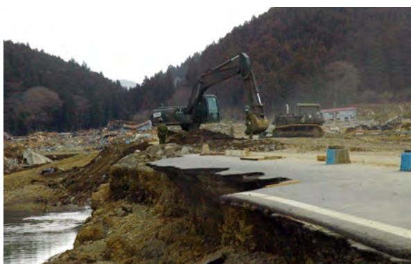
▲戸倉地区の国道45号を補修（2011（平成23）年3月22日）

何もかも流された住民たちの命を救うための食料や救援物資の輸送もインフラの再生も、すべては車両が通れる道が開かれなければ始まらなかった。鉄骨を切断し、側溝の土を掻き出し、橋を掛け、道路を確保するための厳しい作業が数ヶ月にわたり続けられた。