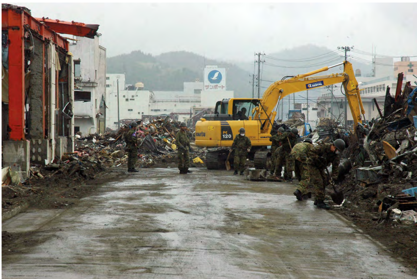
▲志津川地区での道路の瓦礫を取り除く陸上自衛隊北部方面隊（2011（平成23）年5月12日）

何もかも流された住民たちの命を救うための食料や救援物資の輸送もインフラの再生も、すべては車両が通れる道が開かれなければ始まらなかった。鉄骨を切断し、側溝の土を掻き出し、橋を掛け、道路を確保するための厳しい作業が数ヶ月にわたり続けられた。